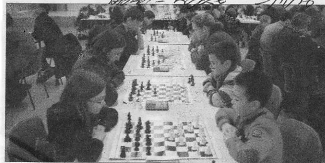
Le tournoi albigeois en 2017.