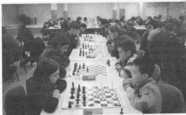
Près de 200 joueurs sont attendus.