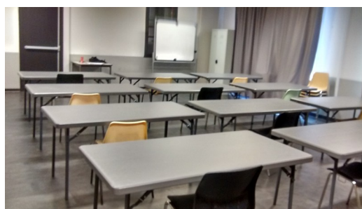
Implantation en position scolaire (4m 2 par table)